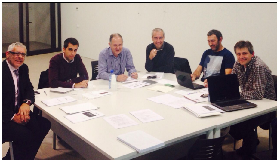
Il·lustració 1: Els Alcaldes, els regidors de promoció econòmica i els presidents de les associacions d'empresaris de Solsona i Cardona en una reunió de treball per prioritzar les actuacions del Pla d'Acció

Les 4 entitats han identificat conjuntament els problemes del territori, n'han seleccionat els prioritaris, han analitzat i triat solucions, les han programades i han definit mecanismes de seguiment i avaluació per tal de donar lloc al present Pla d'Acció.